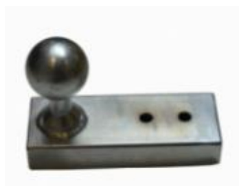
Vidle Herkules – Koňka